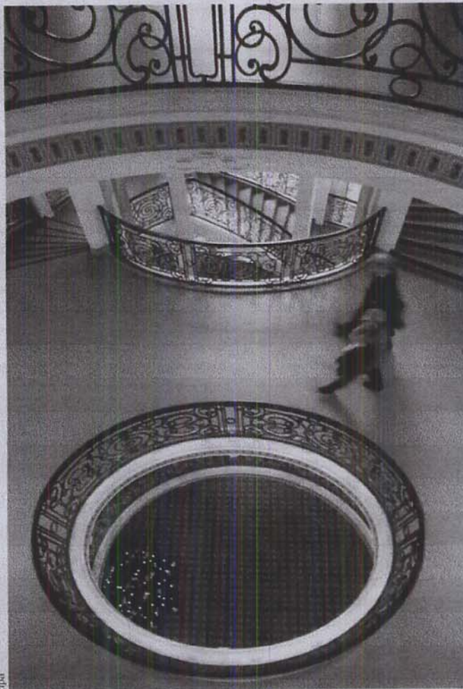
BEI DEN OBERLANDESGERICHTEN sind spezielle Vergabesenate eingerichtet worden, die über die Beschwerden gegen die Entscheidungen der Vergabekammern zu befinden haben. Unser Foto zeigt den Flur des Düsseldorfer Oberlandesgerichts, dessen Gründerzeit-Architektur nach gründlicher Renovierung wieder in neuem Glanz erstrahlt.

Insgesamt bleibt zu hoffen, dass durch die Einführung des neuen zweistufigen Rechtssystems der Wettbewerb fairer und transparenter wird, so dass alle Bieter die gleichen Chancen auf Erteilung eines Auftrages erhalten.